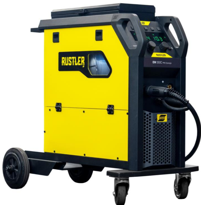
Rustler EM 350C PRO Synergic

Invertoarele de sudură compacte Rustler MIG PRO reprezintă cea mai bună soluție pentru majoritatea provocărilor obișnuite din domeniul sudării. Echipate cu cea mai recentă tehnologie din domeniul invertoarelor, acestea combină consumul redus de energie cu performanța optimizată de sudare.