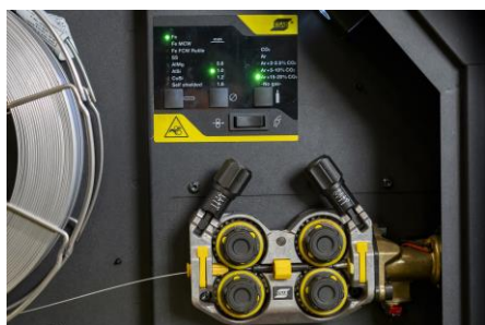
Cel mai bun mecanism de alimentare cu sârmă din clasa sa