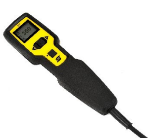
ER 1 Telecomandă multifuncțională cu afișaj încorporat