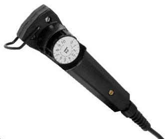
MMA 3 Telecomandă tradițională pentru reglarea amperajului